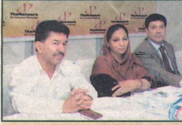
سیمنار میں ماہرین اکتھار خیال کر رہے ہیں

نفاذ کریں۔ کیونکہ ان بچوں کی حالات میں نہ تو صاف پانی ملتا ہے نہ ہی بچوں کی بولیں اسلوا کر کے کرنے کا کوئی انتظام ہوتا ہے۔ بچے کو دودھ پلانے کے لئے اس کے لئے کم از کم دو گھنٹے کی ضرورت ہوتی ہے۔ انہوں نے کہا کہ مختلف شعبوں کی تنظیمیں بچوں کی پیدائش کے بعد پہلے ہفتے میں ہی موت کا شکار ہونے والے بچوں کو دودھ پلانے کی ضرورت ہے کہ وہ شہ خواروں کی اموات کو کم کرے۔